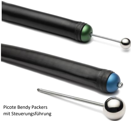
Picote Bandy Packers mit Steuerungsführung

Die Picote Bandy Packer sind Teil der Picote Pro Packer Serie und wurden speziell für Punktrepaturen in Rohrbögen entwickelt. Natürlich funktionieren sie genau so gut in gerade verlaufenden Rohren. Diese Packer lassen sich im Rohrsystem auch durch Mehrfachbögen hindurch zur Renovierungsstelle schieben. Dank des innovativen und patentierten Frontantriebssystems, das an der Stirnseite des Packers seine Wirkung ausübt, können Sie den Packer weiter und durch mehrfache 90°-Bögen manövrieren. Steuerungsführungen unterstützen zudem die Bogengängigkeit und das Abzweigen in Nebenleitungen. Picote Bandy Packer sind ideal für Punktrepaturen mit 90°-Mehrfach-Bögen, Durchmessersprüngen und Siphons.