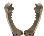
Original Grabber Klauen-Satz 3

Original Grabber wird mit beiden Klauensätzen