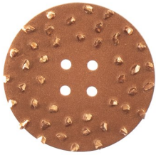
Liner-Entferner 3mm Frontplatte