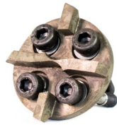
Liner-Entferner Flachfront- Bohrkopf

Die beiden vorderen Bürsten des Twister Liner-Entferners sorgen für zusätzliche Stabilität, während die hochbelastbare Frontplatte mit großen Karbiden und der vordere Bohrkopf für eine effiziente Entfernung kollabierter Liner sorgen. Erhältlich für DN100 und 150, geeignet für sowohl gelinerte als auch ungelinerte Rohre.